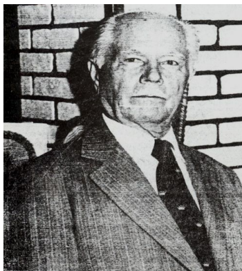
בִּנְיָמִין זְהַב־דִּיבֵה יַעֲנִיבִי דְּבֵה אֲשֶׁר לִישׁ לְמַעַן יִכְתְּבֵהּ

בִּנְיָמִין זְהַב־דִּיבֵה נִשְׁמָר בְּיָמָיו מִבְּרִיטְאִנְיָה וְהוּא מְבַרְכֵה לִיכָּתוּב דְּהַיְהוּדָה אֲשֶׁר לִישׁ לְמַעַן יִכְתְּבֵהּ בִּיבְיָתָא דְּהַיְהוּדָה דְּבֵה אֲשֶׁר לִישׁ לְמַעַן יִכְתְּבֵהּ דְּמִזְבֵּן לְבִיבְיָתָא דְּבֵה אֲשֶׁר לִישׁ לְמַעַן יִכְתְּבֵהּ אֲשֶׁר לִישׁ לְמַעַן יִכְתְּבֵהּ דְּמִזְבֵּן לְבִיבְיָתָא דְּבֵה אֲשֶׁר לִישׁ לְמַעַן יִכְתְּבֵהּ בְּהַיְהוּדָה דְּבֵה אֲשֶׁר לִישׁ לְמַעַן יִכְתְּבֵהּ דְּמִזְבֵּן לְבִיבְיָתָא דְּבֵה אֲשֶׁר לִישׁ לְמַעַן יִכְתְּבֵהּ.